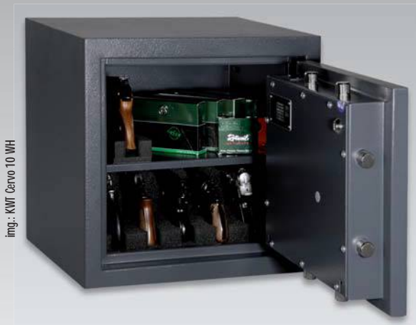
img.: KWT Cervo 10 WH

Für Deutschland gilt nach §36 WaffG und §13 AWaffV: Es dürfen mehr als 10 Kurzwaffen zusammen mit Munition in einem Wertschutzschrank der Klasse I nach EN 1143-1 nach deutscher Gesetzgebung aufbewahrt werden.