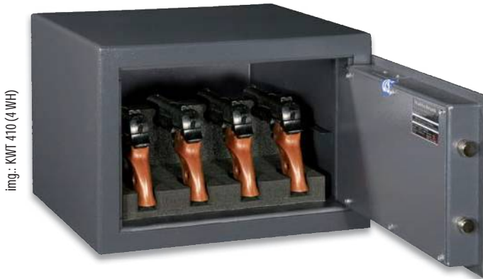
img.: KWT 410 (4 WH)