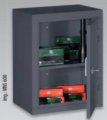
img.: MNS 600

Munitionsschrank · Ammo safe · Coffre à munitions