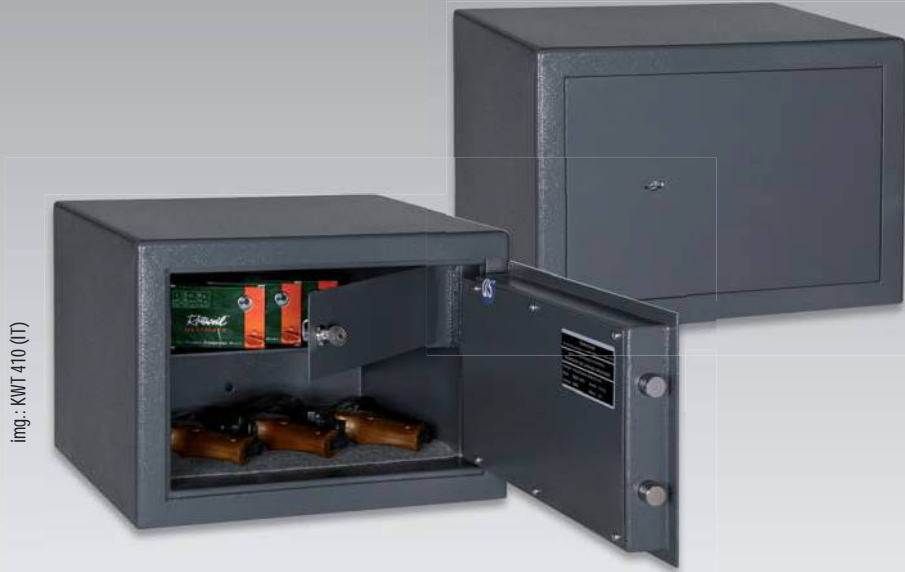
img.: KWT 410 (IT)

Nur relevant für Deutschland · Just relevant in Germany · Concerne seulement l'Allemagne: