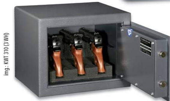
img.: KWT 310 (3 WH)

Standardschloss · Standard lock · Serrure standard 01 Schlossvariante · Lock type · Variante de serrure 12 23